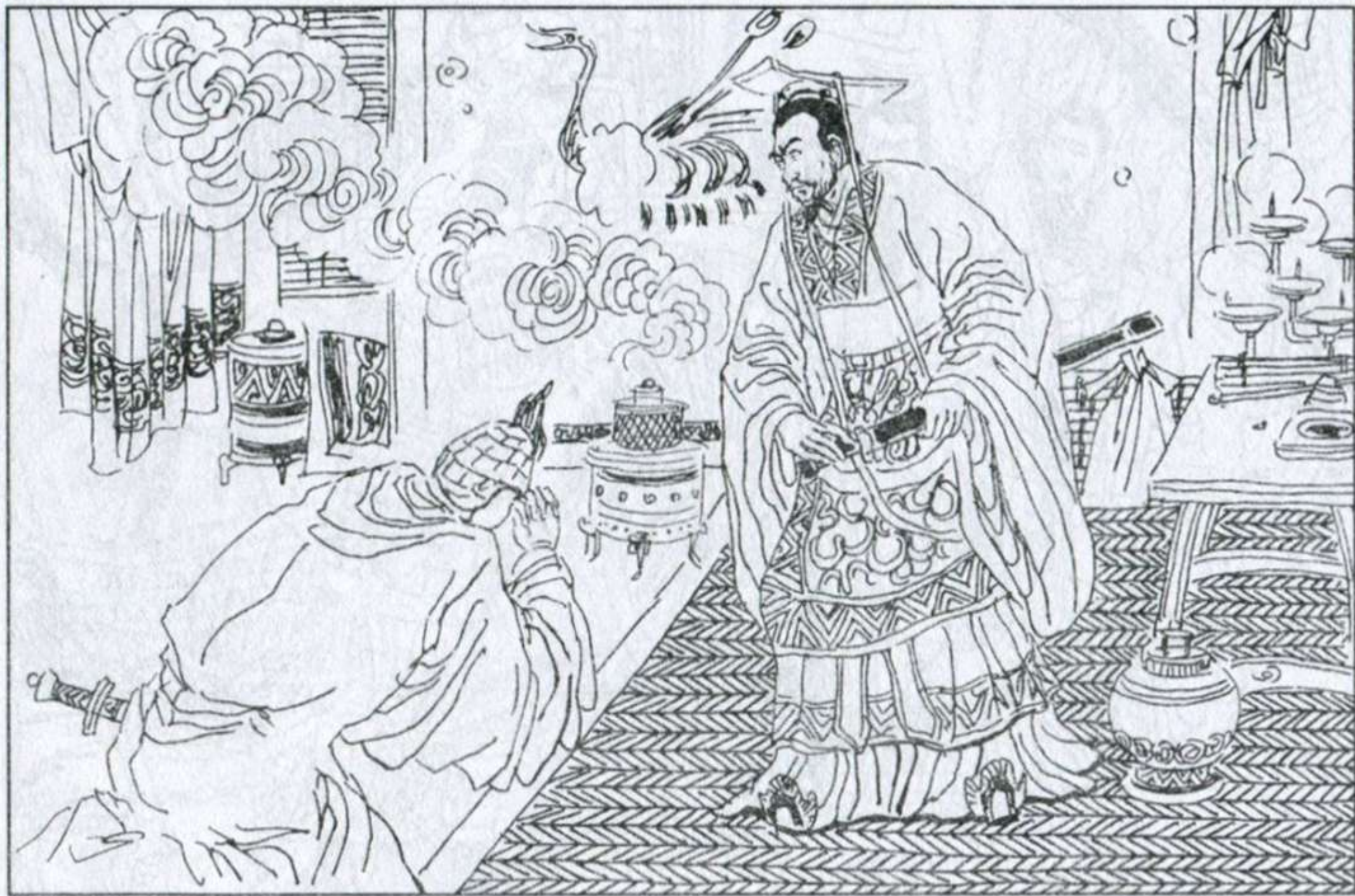
13. 使者急回楚稟告。楚王怒不可遏，准备发兵攻秦。