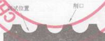
图3 孔底板厚测试位置示意图

5.1.7 毛细型排水板孔底板厚度采用尖头式千分尺(精度0.01 mm)测量排水孔中心对应处板厚(图3)。在排水板纵向距端部300 mm以外,沿样品宽度方向随机选取试样,削除集水槽隔断。试样距样品边缘不小于200 mm,宽度为15 mm,长度为20 mm,个数不少于5个。每个试样测量三次,其最小值作为试样测量值,取试样平均值作为测量值。