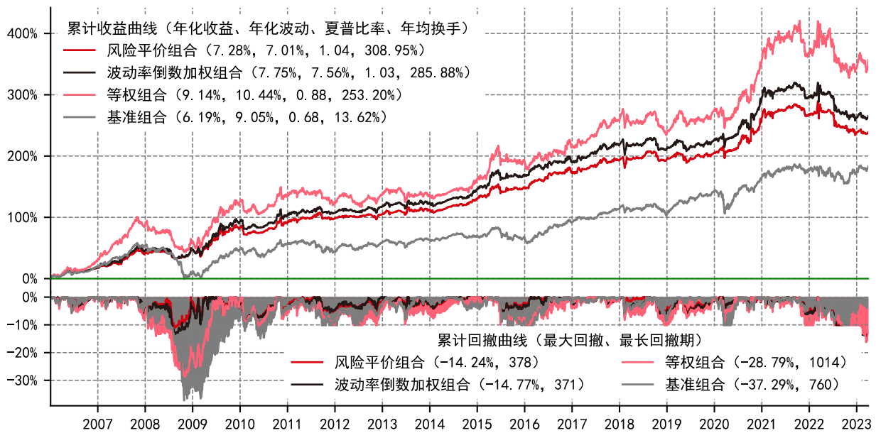
图2：大类资产趋势轮动配置组合累计收益曲线

注1：基准组合为全部20类底层资产的等权组合，月度调仓；注2：交易费率为双边千分之一，不考虑汇兑损失；注3：最长回撤期指发生回撤后至累计收益再创新高的最长持续交易日数。